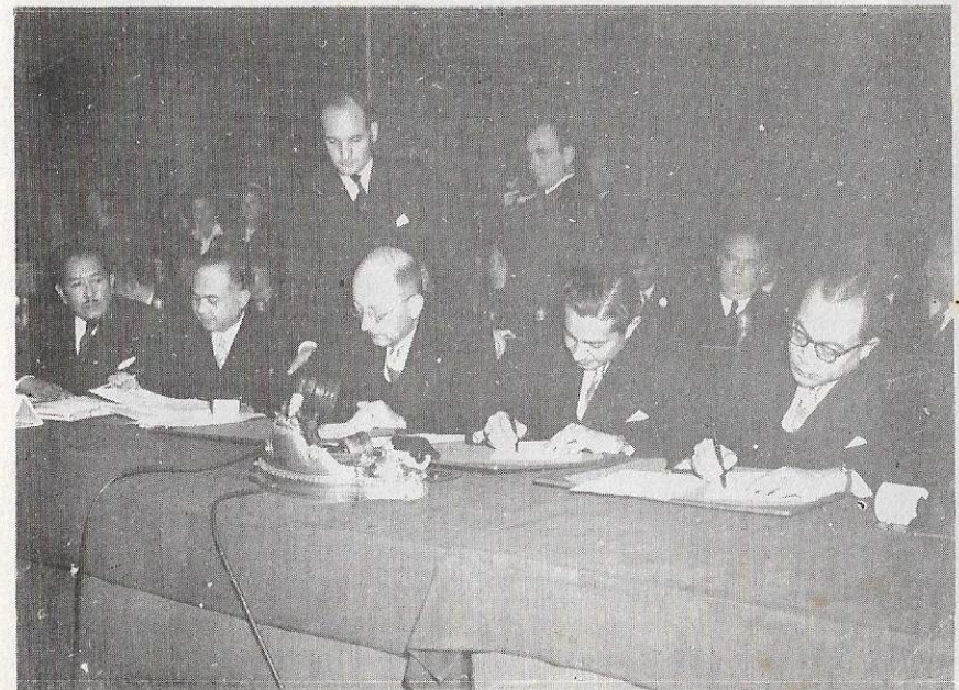
Di Nederland sebagai anggota Delegasi ke KMB. - (Idayu).