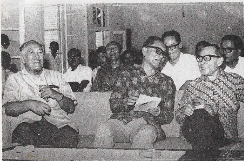
Di Gedung Kebangkitan Nasional pada waktu menghadiri ceramah Dr. H. Roeslan Abdulgani.